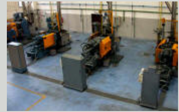
Alcuni dei macchinari utilizzati per la pressofusione di zama